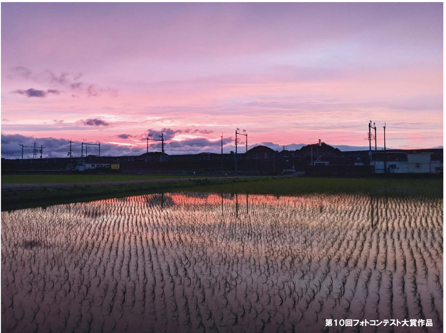
第10回フォトコンテスト大賞作品

LINE公式アカウントにてかんがい状況の 配信を行っています。登録をお願いします!!