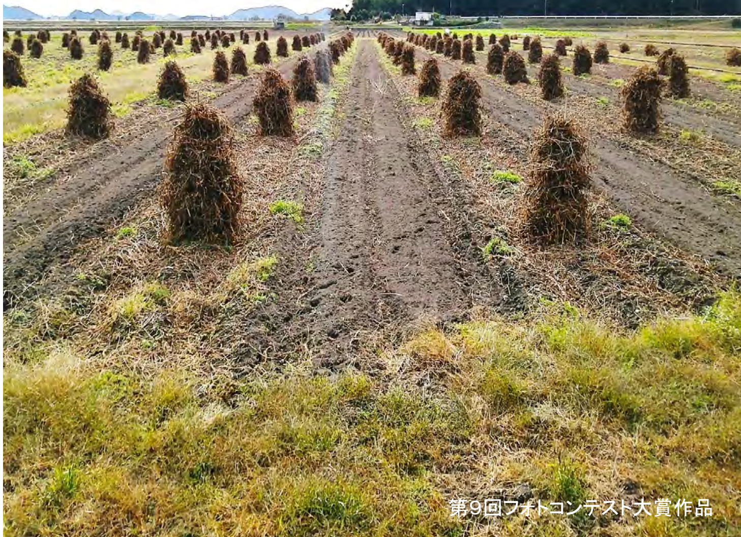
第9回フォトコンテスト大賞作品